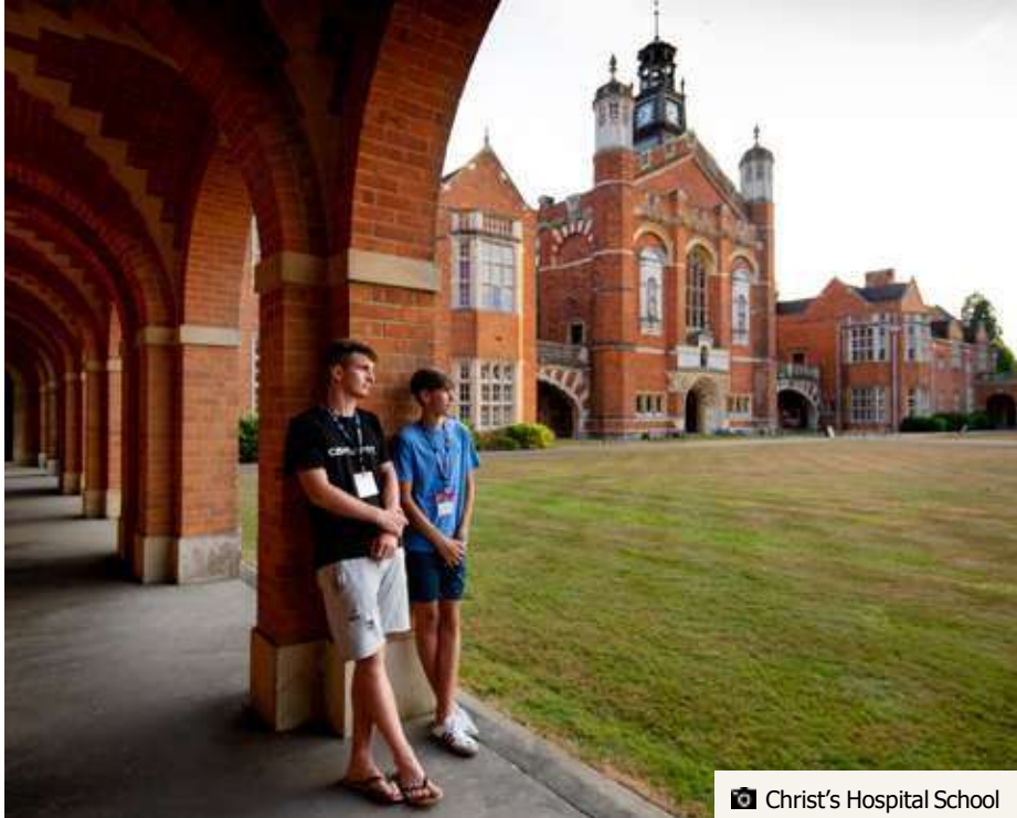
Christ's Hospital School

** (По требованию и при наличии минимального необходимого числа студентов)